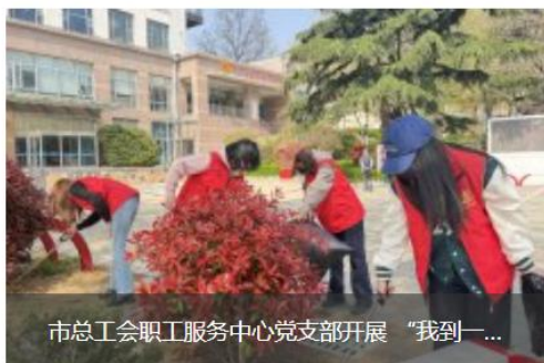
市总工会职工服务中心党支部开展“我到一...