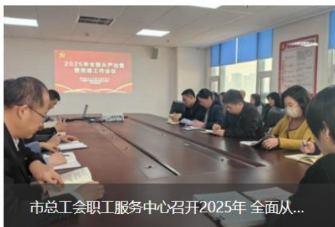
市总工会职工服务中心召开2025年全面从...