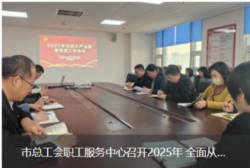
市总工会职工服务中心召开2025年全面从...