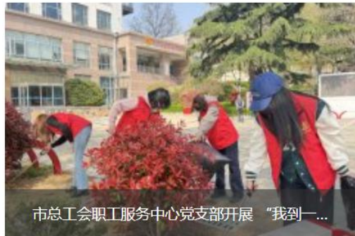
市总工会职工服务中心党支部开展“我到一...